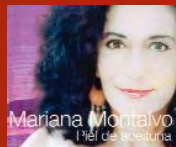
PIEL DE ACEITUNA